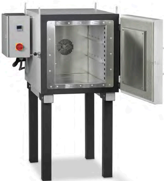
Kiertoilmauni KU 40/65

Uunin runko on valmistettu korkealaatuisesta teräslevystä. Uunin sisäosassa on käytetty ruostumatonta terästä, joka takaa kestävän pitkäikäisen korroosiovapaan uunitilan.