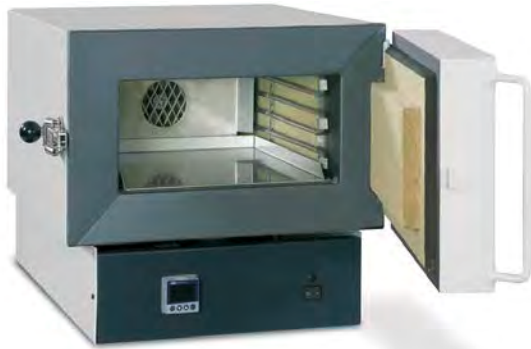
Kiertoilmauni KU 15/65 pöytämalli

Rohde-kiertoilmauunit on tarkoitettu kaikenlaiseen lämpökäsittelyyn kuten päästöihin, vanhentamis-käsittelyihin, esilämmitykseen, kuivaukseen, kutis-tamiseen ym. polttoihin.