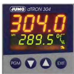
JUMO dTron 304